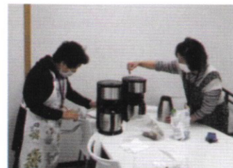
ぶんか・みかんの会カフェ

見守り協力員は、定期的に行われる勉強会に参加して、地域の支え合い活動推進のため、研鑽をつんでいます。時には認知症サポーターとして、認知症に関心のある方々の集い「ぶんか・みかんの会カフェ」の担い手として、サポートしています。見守り協力員について聞いてみたいなど思った方は、下記のみまもり相談室へお問合せください。