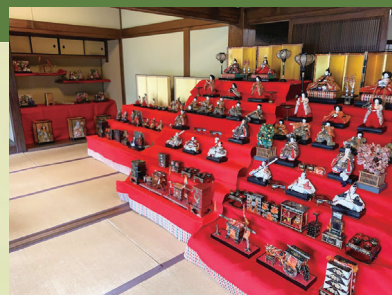
昨年度の展示風景